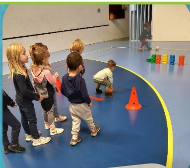
Initiation au Handball