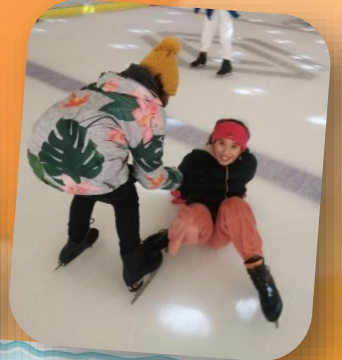
Quelques chutes qui n'entament pas la bonne humeur générale

Responsable de la publication : Nathalie Despaux Comité de rédaction : Alexandra Cavero