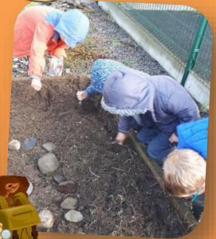
Des fouilles archéologiques, Quelques belles trouvailles mais pas un dinosaure