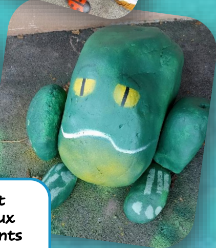
Coccinelles et grenouille iront prendre place dans les nouveaux parterres aménagés par les agents des espaces verts de la Mairie devant l'école Maternelle.