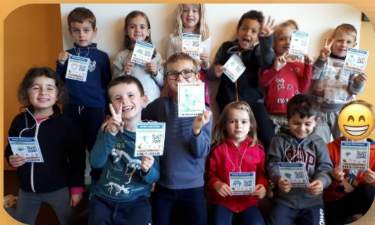
Les scientifiques et leurs badges d'accès