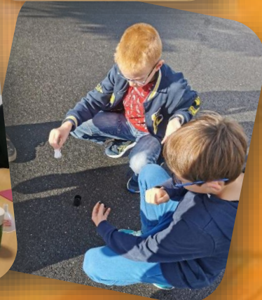
Expériences de physique/ chimie & lancement d'une mini-fusée