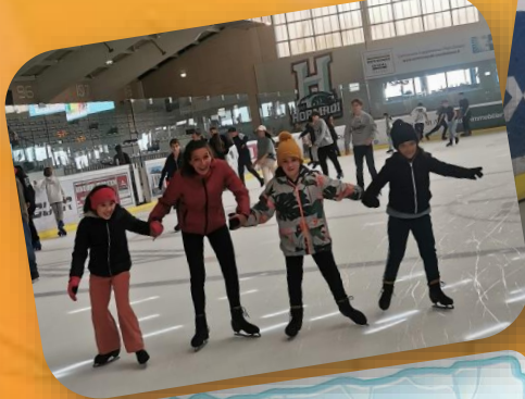
On cherche l'équilibre à plusieurs...