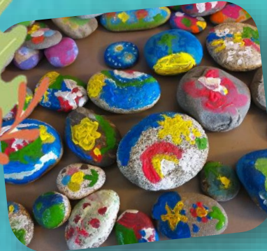
"Pimp my galet"